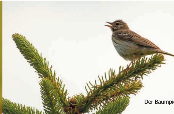
Der Baumpieper liebt Waldränder