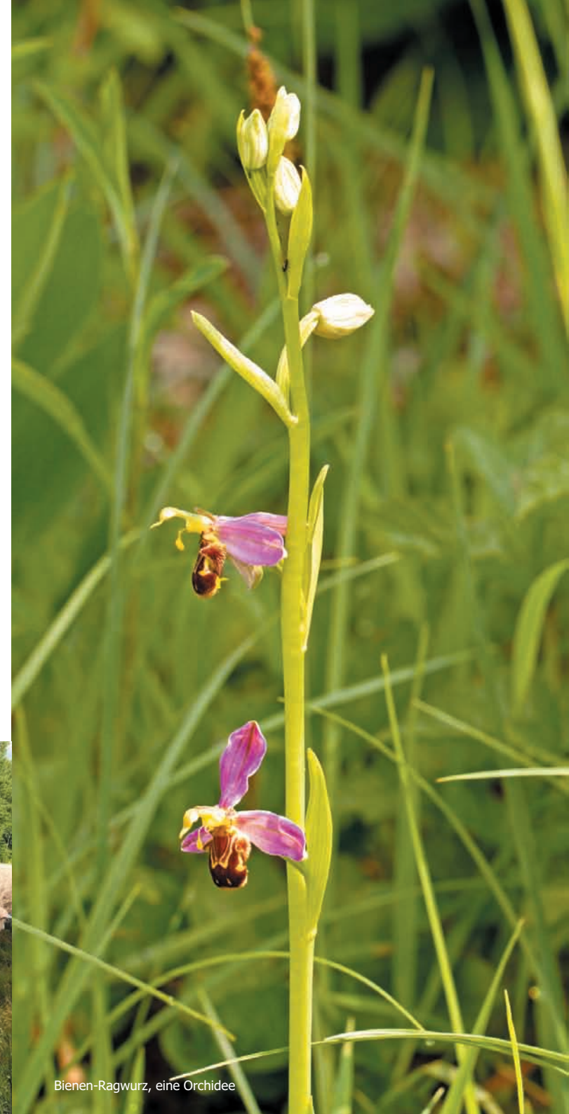
Bienen-Ragwurz, eine Orchidee