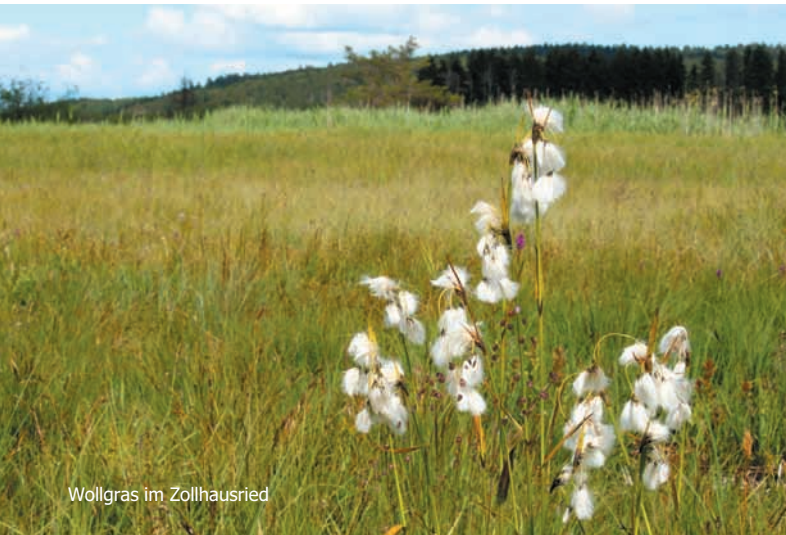
Wollgras im Zollhausried

In 17 Fördergebieten – von Königsfeld im Norden bis Blumberg im Süden und Geisingen im Osten – sorgt das NGP Baar dafür, dass diese Lebensräume erhalten und aufgewertet werden. Ebenso, dass Tiere und Pflanzen von einer Fläche zur nächsten wandern können. Das ermöglicht ihnen, neue Biotope zu besiedeln, was angesichts des Klimawandels extrem wichtig ist.