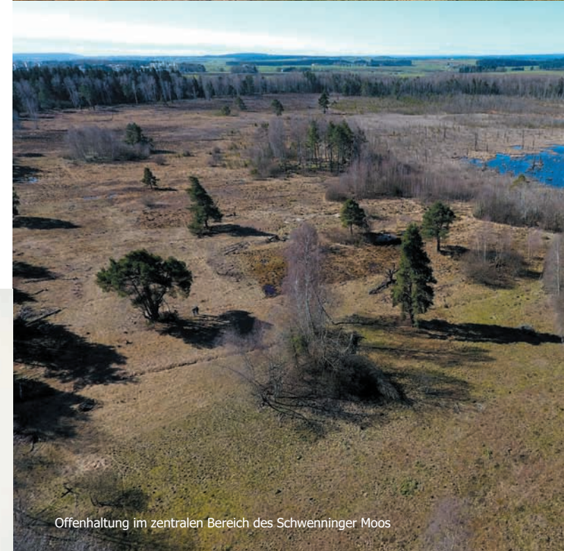
Offenhaltung im zentralen Bereich des Schwenninger Moos