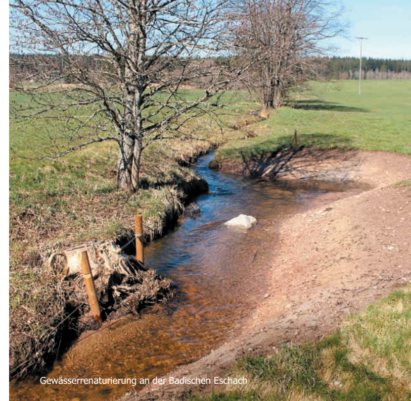
Gewässerrenaturierung an der Badischen Eschach